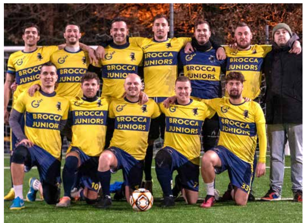
📷 La formazione del Bar G/Brocca Juniors