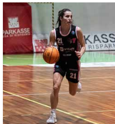
📷 19 punti per Sammartini

terclub in una partita nella quale le rivierasche hanno saputo tenere il passo delle avversarie solo nel primo tempo, e anche per il Forna, sconfitta in casa di misura dal Giants Marghera.