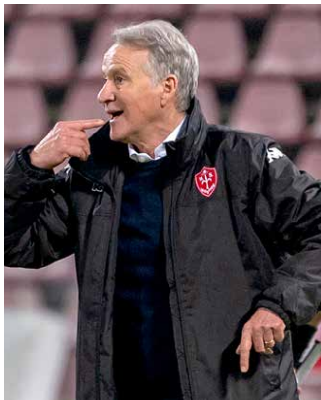
📷 L’allenatore della Triestina, Attilio Tesser: dal suo ritorno in panchina l’Unione ha conquistato 23 punti in 11 partite

A ttilio Tesser sa bene il valore di una vittoria come quella di Vercelli, frutto di una partita non esaltante, ma proprio per questo pesantissima per il risultato maturato. “È stata una gara sporca, ma l’abbiamo preparata aspettandoci quello che poi si è verificato in campo. Non era una partita facile - sottolinea l’allenatore della Triestina -, contro un avversario che giocava molto sulle seconde palle e sull’aggressività, ma ci abbiamo messo intensità e aggressività su un terreno di gioco particolare”. Tesser ha apprezzato la concentrazione che la sua squadra ha messo in tutti i 90’: “Dovevamo stare attenti in particolare alle loro fisicità, che in area di rigore si fa sentire ed è un fattore importante in questa categoria, magari ci è mancato qualcosa nella capacità di ribaltare l’azione con più velocità, ma sapevamo che non sarebbe stato un incontro facile contro un avversario che arrivava da un periodo positivo, al di là dell’ultima sconfitta”. Secondo il tecnico alabardato, “nel secondo tempo abbiamo fatto qualcosa in più, soprattutto a metà frazione. C’era un rigore per noi prima del gol, oltre a quello proprio nell’azione che ha portato alla rete, ma l’importante è avere portato a casa il risultato, nel complesso anche in maniera meritata, vista le occa-