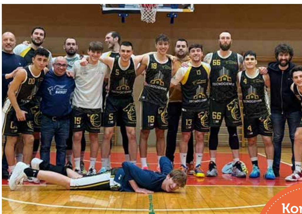
📷 La Tecnogiemme Venezia Giulia festeggia la vittoria contro la Lussetti Servolana