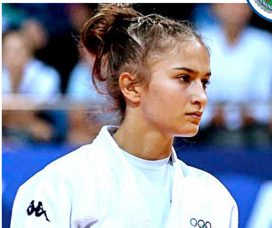
📷 Veronica Toniolo, la stella del judo che ha partecipato all'ultima Olimpiade