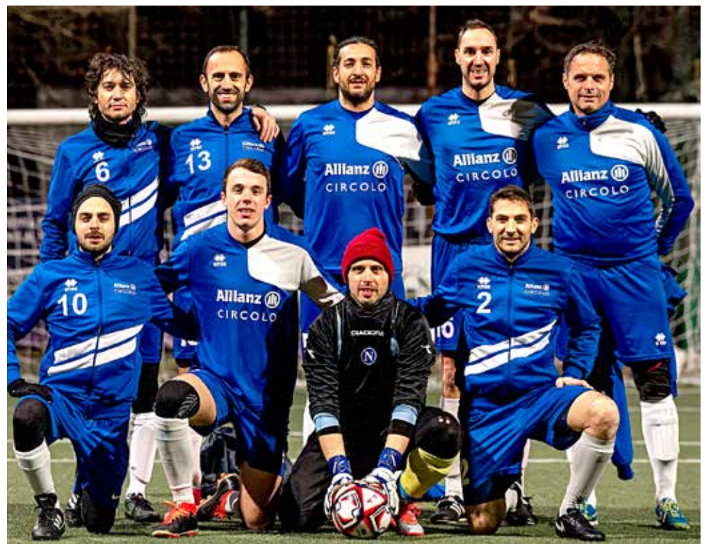
📷 Il Circolo Allianz ha lasciato l'ultimo posto in Serie A

In Serie B, tutto facile per la capolista Dobroleg che travolge 12-1 la Tartaruga con le triplette di Bresich e Tenace. Non gioca la Pizza Smile (rinvia la partita con il Progit) che si trova ora a sei punti dalla vetta, divario però colmabile viste le due partite da recuperare. Stop inatteso, soprattutto per le proporzioni, del Royal Kokal/Cne Ponteggi, superato per 12-3 dal Tripmare, trainato dalla quaterna di Moscato e dalla tripletta di Serra. Bene l'Esse.Data, vittorioso per 7-2 ai danni del Magna/New Sound, mentre non si è giocato il match tra Cral Trieste Trasporti e LaDomenicaBe-