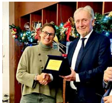
📷 Alcuni momenti della cerimonia di premiazione del progetto “Nati per Muoversi”, ideato e organizzato dall'associazione Benessere