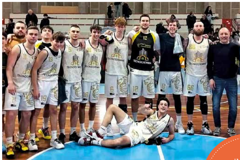
📷 Nuova vittoria per la Tecnogiemme Venezia Giulia, capolista nel girone di DR1