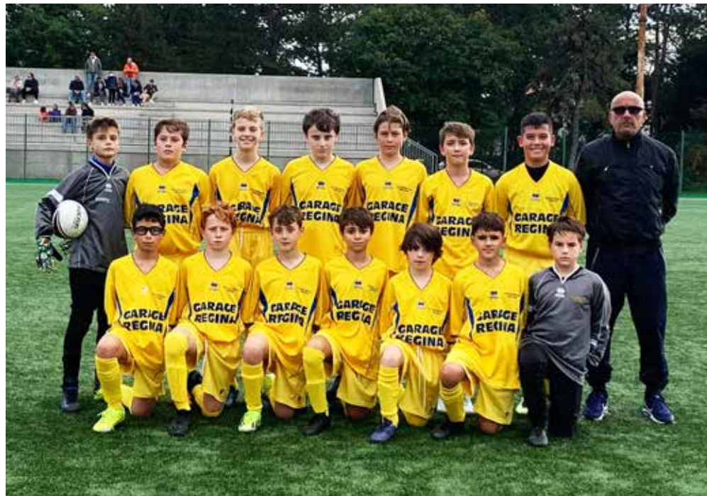
📷 La formazione della Polisportiva Opicina C

P artita combattuta tra le compagini A di Sant'Andrea e San Luigi. Bellissimi spunti tecnici da entrambe le parti, il risultato sorride alla formazione di via Locchi, che si impone per 3-2 rimontando negli ultimi due parziali. Grande equilibrio tra Cgs e Zarja che giocano una gara molto divertente, pareggiando tutte le frazioni. La Roianese A vince tutti e quattro i tempi contro il San Luigi B, bene anche la Trieste Victory Academy A che batte l'Opicina, capace comunque di portare a casa la terza frazione. Nel girone B, vittoria per il Muggia 1967 A ai danni dei bianchi del Domio che riescono quantomeno a pareggiare l'ultima frazione dopo tre successi rivieraschi. Ancora un successo per la San Giusto Football Academy che supera il San Luigi C mostrando buone cose sul piano del gioco. L'Academy B ha la meglio sul San Giovanni nero vincendo tre tempi contro