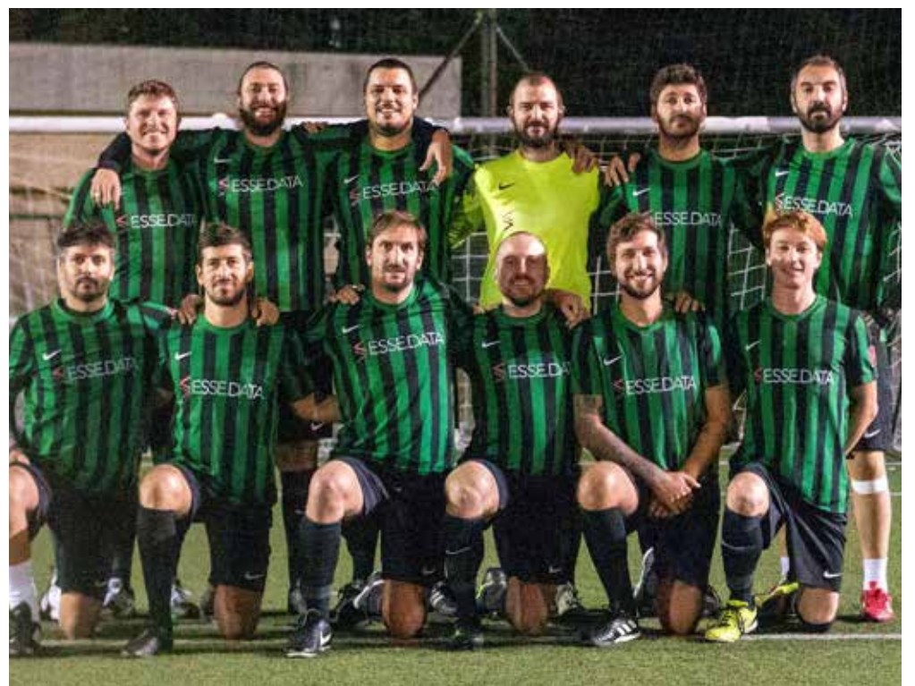
📷 La formazione dell'Esse.Data

Rinviata la partita tra La Tartaruga e Cral Trieste Trasporti.