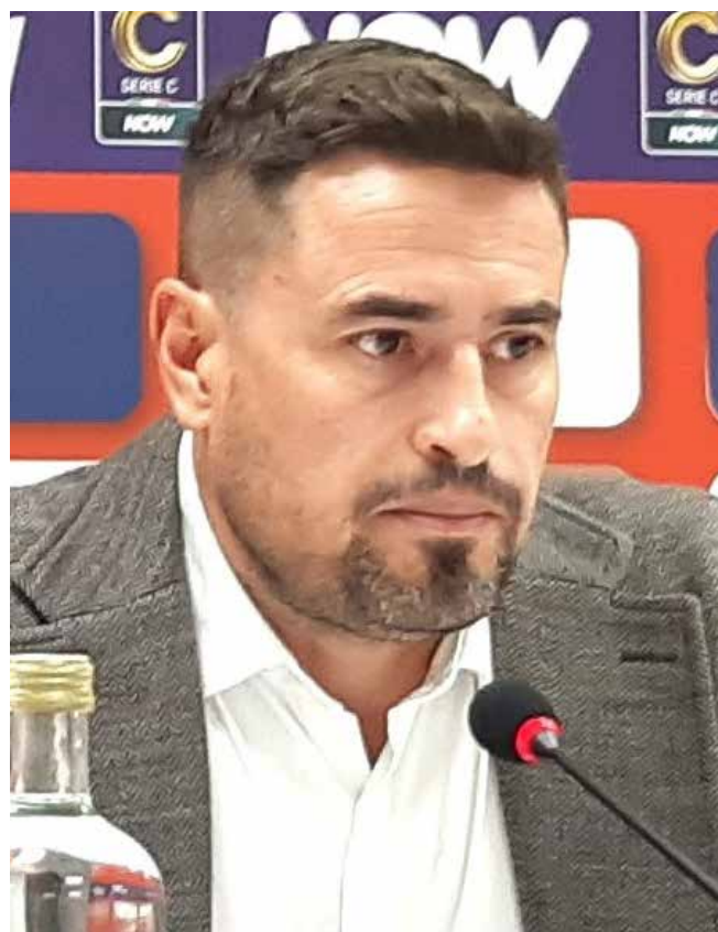
📷 Il nuovo tecnico della Triestina, Pep Clotet, durante la conferenza stampa di presentazione di lunedì scorso

S perava sicuramente in un esordio migliore Pep Clotet , se non altro sul piano del risultato. Ma il nuovo allenatore della Triestina guarda agli aspetti positivi: "Ho visto una squadra che ha lavorato bene tutta la settimana, sulla mentalità e su un cambio di modulo che ci permettesse di essere più aggressivi. A livello di intensità e voglia la prestazione è stata buona, anche se ci manca ancora qualcosa a livello fisico". Secondo Clotet "è un momento in cui gira tutto male, abbiamo concesso in tutto tre attacchi, due difesi bene e uno no, commettendo un fallo evitabile. Per contro, abbiamo creato diverse occasioni e indubbiamente dobbiamo essere più concreti perché se non segni alla fine diventa un terno al lotto e rischi di pagare. Quel gol preso alla fine è un po' l'immagine attuale di questa stagione, ma sono convinto e fiducioso, anche dopo quello che ho visto oggi, che con molto sacrificio e molto lavoro si può uscire da questa situazione, prendendo il positivo e migliorando sugli aspetti dove siamo mancati". Secondo il mister alabardato "c'è da lavorare sia sulla testa che sull'aspetto della condizione fisica. La squadra è chiaramente molto abbattuta, perché sappiamo di avere comandato la partita