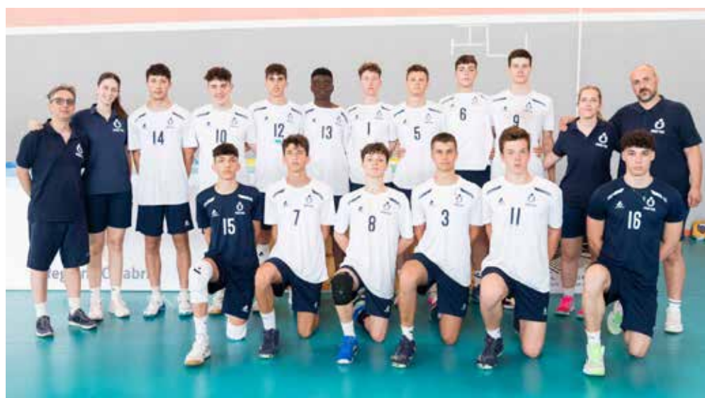
📷 La rappresentativa femminile e quella maschile Fvg al Trofeo delle Regioni