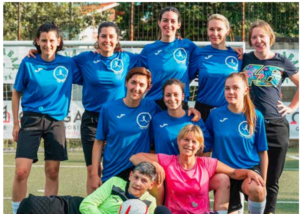
Il Team Assacro, vincitore della Crese Girl