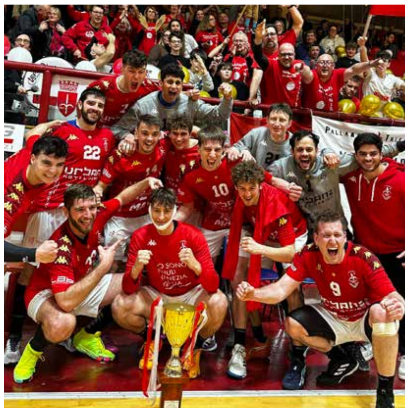
📷 La Pallamano Trieste 1970 festeggia davanti ai propri tifosi dopo il match di sabato