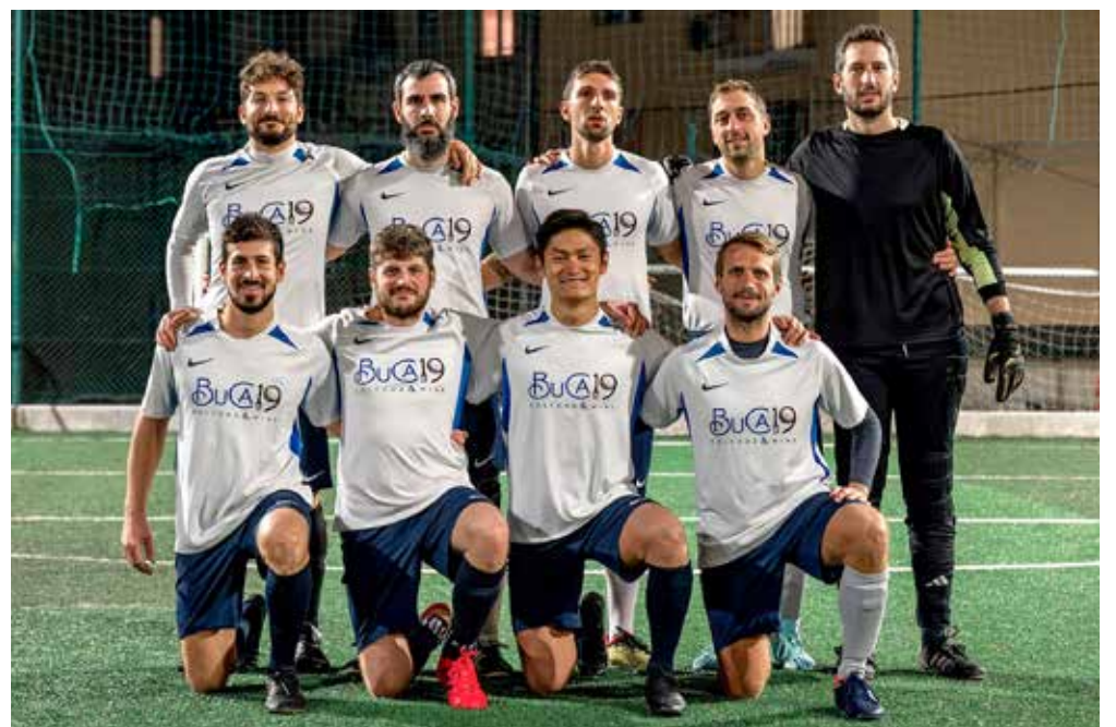
📷 Il Ristorante Buca 19, vittorioso sul Bar G