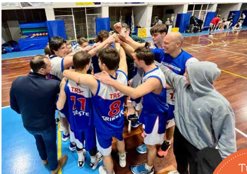
Il Bor Radenska continua a rincorrere la Tecnogiemme Venezia Giulia in DR1