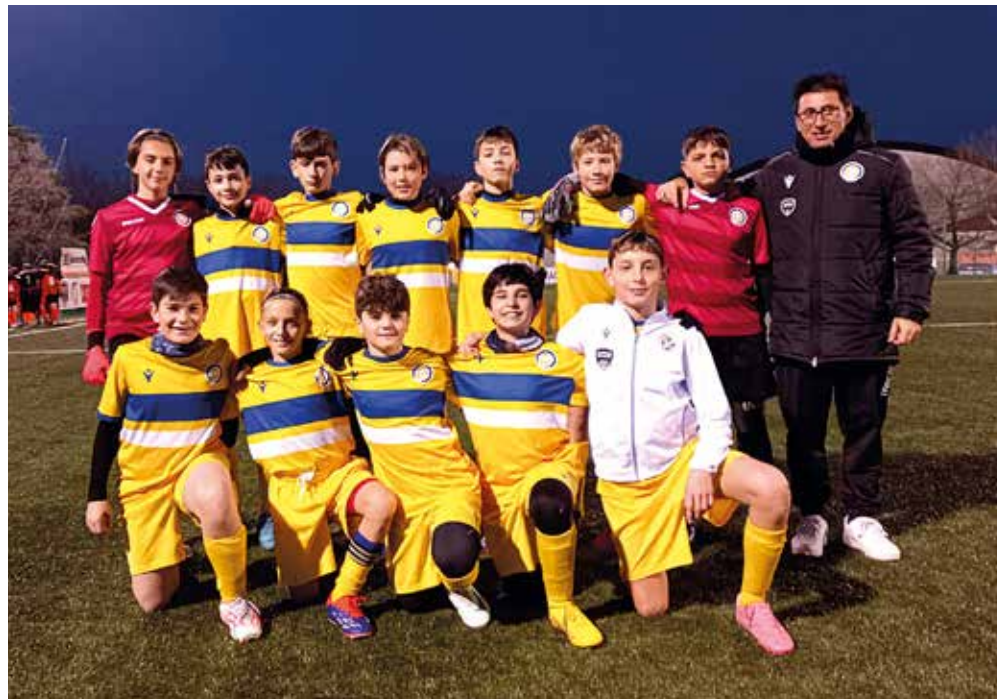
📷 La squadra "A" della Polisportiva Opicina

Nel gruppo B, vincono tutti i parziali San Giovanni nero e San Luigi B. La squadra di viale Sanzio si impone sul Sant'Andrea B, mentre i biancoverdi hanno la meglio sul-