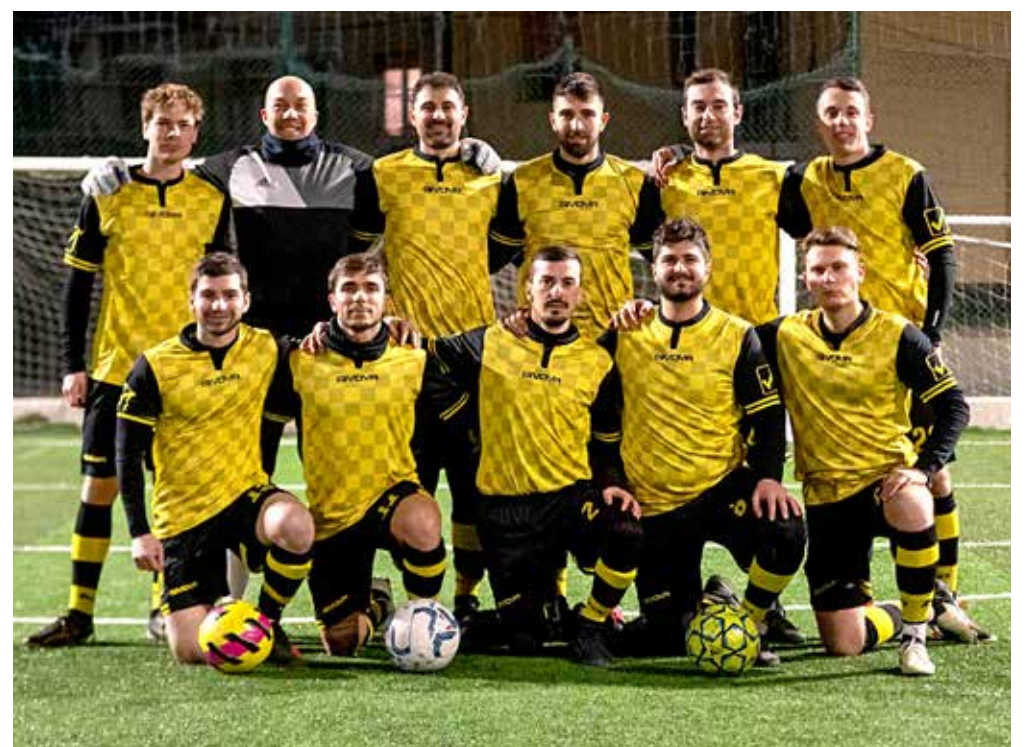
📷 Il Progit, quarta forza del campionato di Serie B

SERIE A TERMODRIM - ALLIANZ 10-1 GOL: 4 Makivic, 2 Ristic, 2 Zyba, Salkic, Hrvatini;