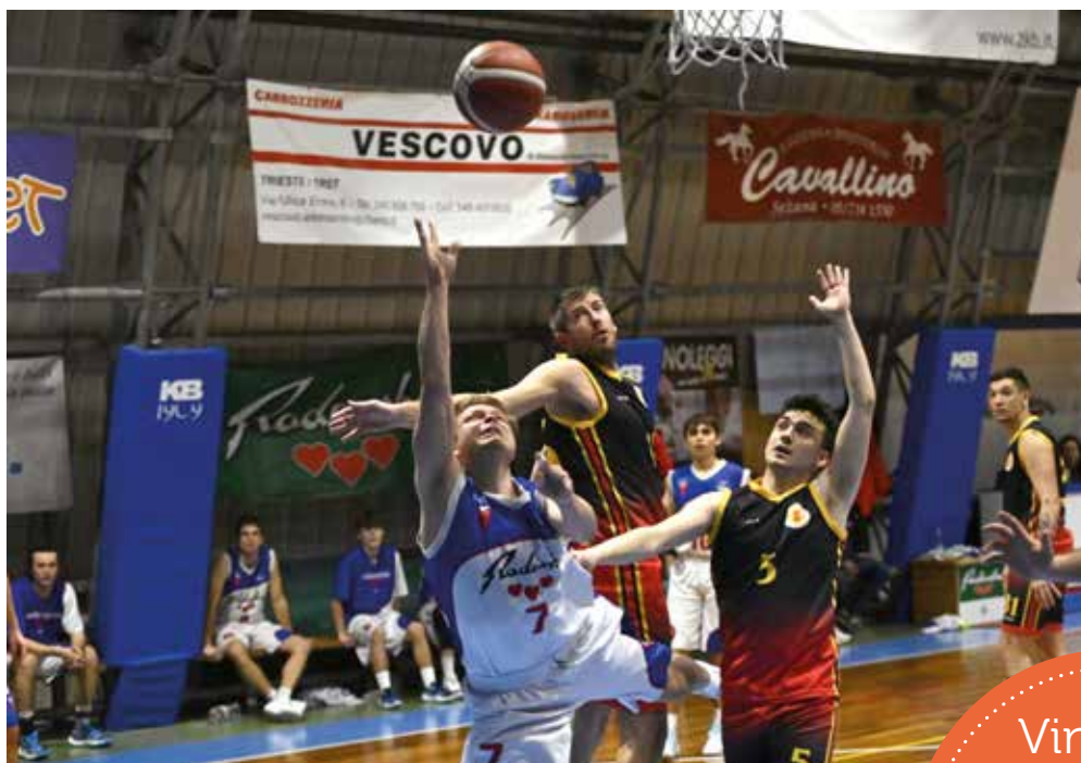
📷 Una fase del derby tra Bor e Servolana, vinto dai padroni di casa

Si continua a giocare invece nelle serie inferiori, a iniziare dalla C: fermo il basketTrieste che riprenderà le proprie fatiche venerdì prossimo nel match interno contro la Humus Sacile, è un epilogo amaro quello del Kontovel a San Daniele. Un grande recupero dopo essere stati anche sotto di 14 lunghezze non si concretizza in vittoria per la squadra di Popovic, sconfitta 72-71 e costretta a rimanere provvisoriamente all'ultimo posto del girone, sempre a -2 dalla coppia basketTrieste - UEB Cividale. In terra friulana non bastano i 21 messi a referto da Skerl e i 19 di Daneu per uscire con