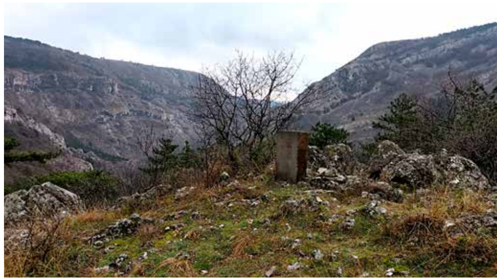
📷 I resti del "grubla" che si possono trovare sulla cima del San Michele

G rubla è un termine di origine slovena che, nei dialetti locali, denota un accumulo di pietre; in passato la medesima parola fu usata pure per riferirsi ai castellieri. Risalenti alla protostoria - un periodo di collegamento tra la preistoria e l'età antica - e più di preciso all'età del bronzo e del ferro, tra il X e il I secolo a.C. i castellieri si erano diffusi nell'area della Venezia Giulia e della Dalmazia, prevalentemente sulle alture, pertanto non solo a scopo abitativo ma anche di controllo. Questi villaggi fortificati furono, in alcuni casi, i "precursori" degli oppidi romani e, in seguito, delle città medievali. Già dalla precedente amministrazione di Dolina si era iniziato a parlare di valorizzare, grazie a dei fondi europei, tale patrimonio del comune che unisce Istria e Carso; in un'ottica di continuità l'attuale giunta, in carica da nemmeno un anno, aveva subito voluto dar seguito all'iniziativa, con degli