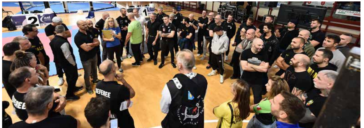
Ben 300 atleti hanno partecipato alla manifestazione più importante degli sport da combattimento in regione

«È andata benissimo e siamo davvero tanto soddisfatti. Hanno presenziato la bellezza di circa 300 atleti a competere per i trofei in palio nelle discipline K1 rules e MMA. Il tutto provenendo da diverse nazionalità, in massa a Trieste per partecipare all'evento, aspetto che ci gratifica come ogni anno. Siamo estremamente soddisfatti sia per lo spettacolo offerto dagli sportivi in gara che per l'affluenza del pubblico, con circa 200 spettatori, numeri difficili da riscontrare in occasioni dilettantistiche. Un ringraziamento speciale all'ente di promozione sportiva Asi, che in collaborazione con Fight Net ha organizzato gli incontri a livello federale».