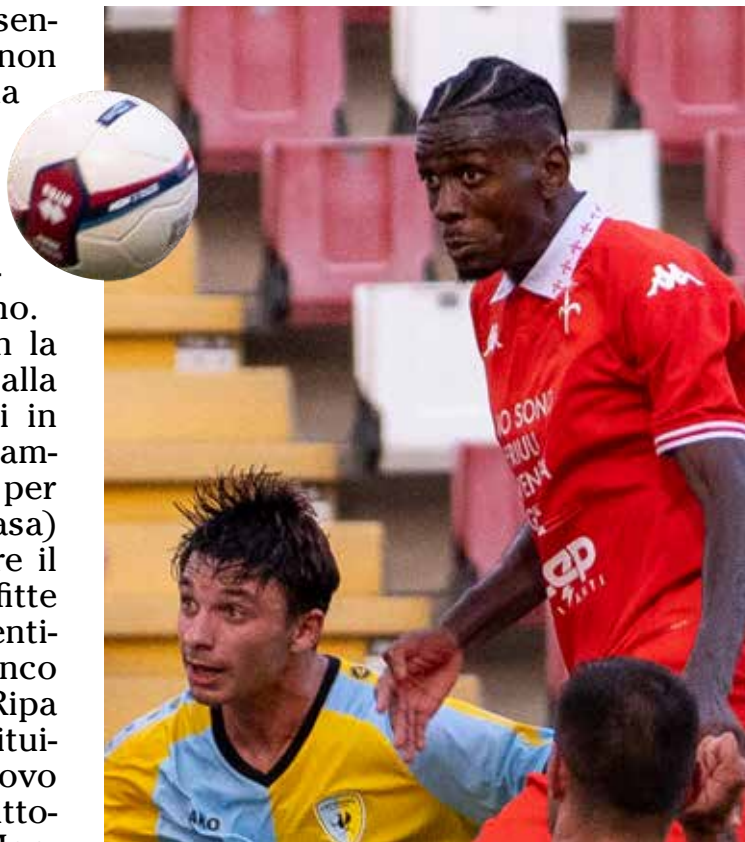
📷 Una fase di Triestina - Arzignano, vinta dall'Unione prima della lunga serie di incontri senza successi