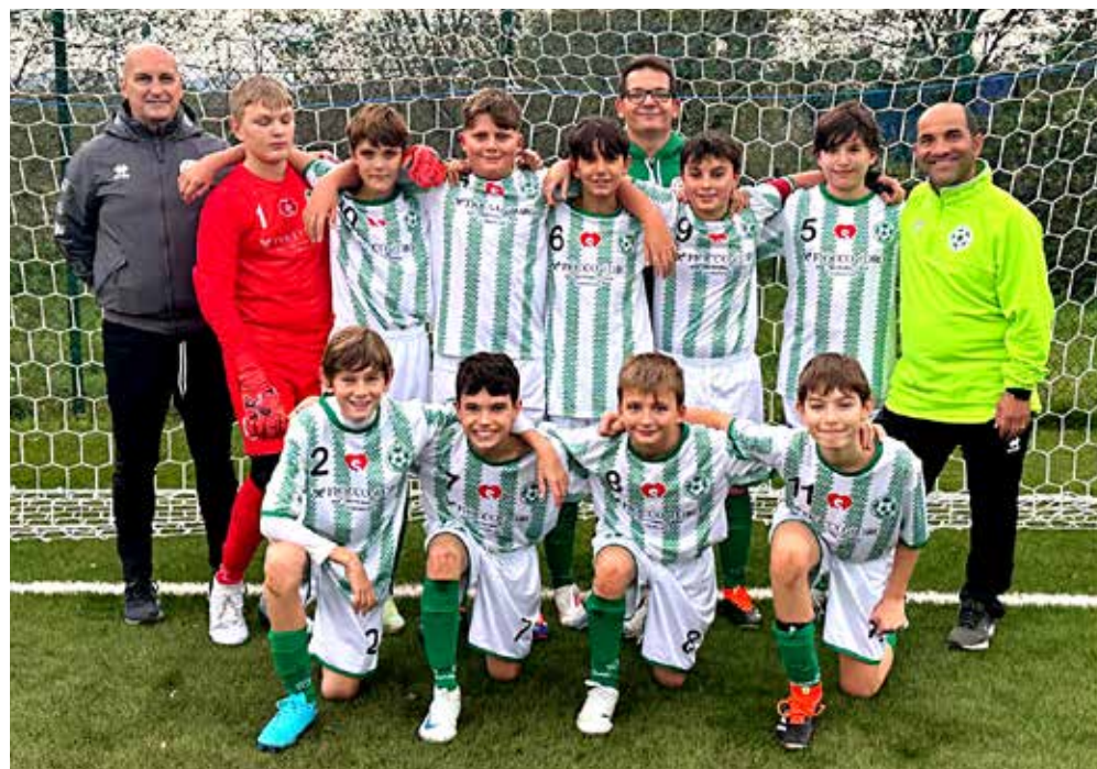
La squadra "bianca" del Domio

Nel girone B, vittoria del Muggia 1967 A ai danni del San Luigi C. Primi tre tempi di marca rivierasca, la squadra di via Felluga trova il guizzo nell'ultimo periodo. Partita molto dinamica e frizzante quella tra i neri del San Giovanni e il Sant'Andrea B, in cui ha brillato la