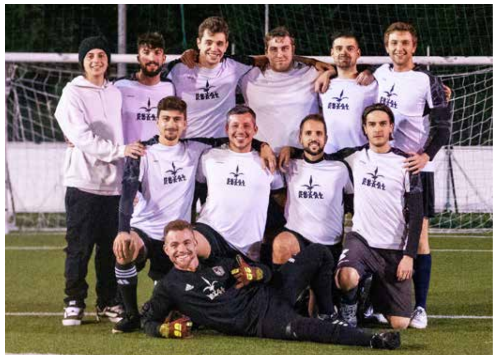
📷 Vittoria in B per il Royal Kokal/Cne Ponteggi